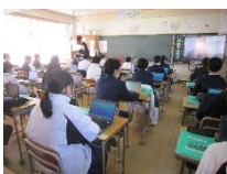
動画編集の様子(1学年)

1学年では、総合的な学習の時間に、新1年生に対して海田中学校のよさをPRする動画を作成しています。改めて、1年間の学校生活を振り返るとともに、進級した自分がどうあるべきかを考える機会になっています。