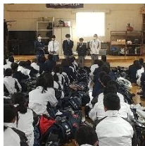
合同帰りの会(2学年)

1学年では、総合的な学習の時間に、新1年生に対して海田中学校のよさをPRする動画を作成しています。改めて、1年間の学校生活を振り返るとともに、進級した自分がどうあるべきかを考える機会になっています。